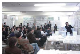
卒業設計・制作発表会の様子