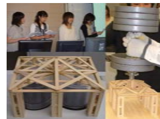
創成型授業の発表会