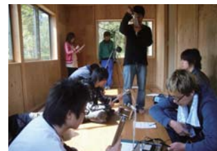
実験住宅を使った体験型授業