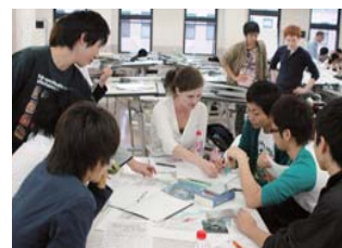
エジンバラ芸術大学の学生との演習