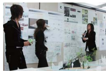
タマサート大学の学生との演習