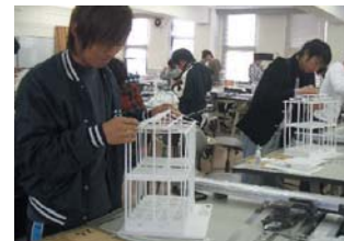
木造住宅骨組み模型制作