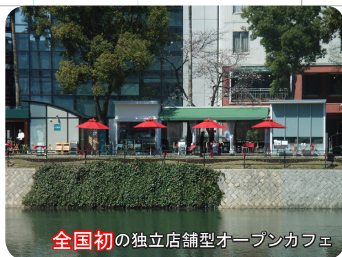
全国初の独立店舗型オープンカフェ

主催 日本建築学会 環境工学本委員会 水環境運営委員会 水と都市小委員会 後援 土木学会、都市計画学会、日本建築家協会、日本造園学会、空気調和・衛生工学会 環境情報科学センター、日本水環境学会、リバーフロント整備センター