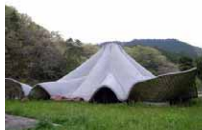
内住コミュニティーセンター (福岡県)