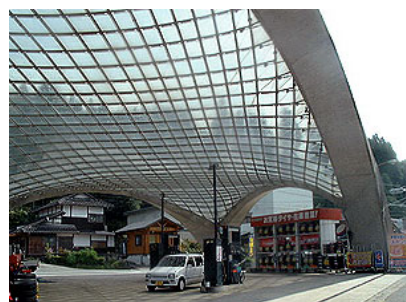
グラスステーション (小国町)