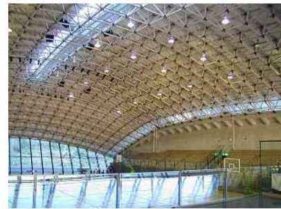
小国町民体育館 (小国町)