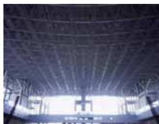
ふるさとパレス プロスペクタ ギャラクシーホール (富山県)