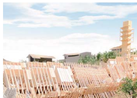
広島平和祈念卒業設計展2021 高橋昂大 (B4)