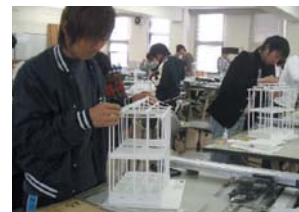
木造住宅骨組み模型制作