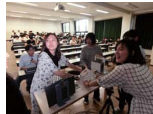
創成型授業の発表会