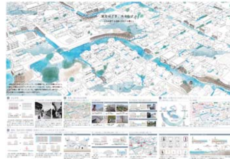
2020年度日本建築学会設計競技 吉本大樹 (M2)+棗田直路 (M2)+瀧下裕治 (M1)+野村陸 (M1)