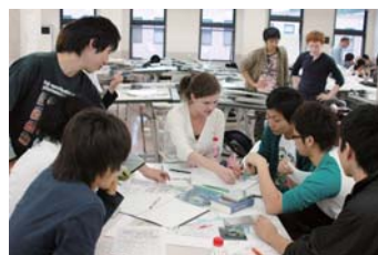
エジンバラ大学の学生との合同演習