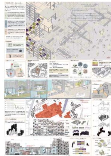
第1回日本建築学生賞 増田耕平 (B4)+三谷啓人 (B4)+若林瑞穂 (B4)+名畑健太 (B4)