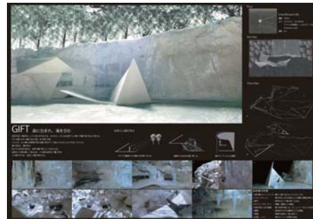
第12回ハーフェレ学生デザインコンペ 松葉大吾 (B4)+末本佳香 (B2)