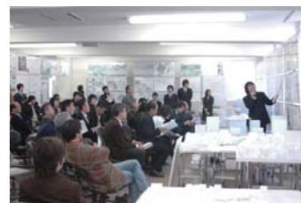
卒業設計・制作発表会の様子