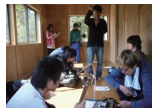
実験住宅を使った体験型授業